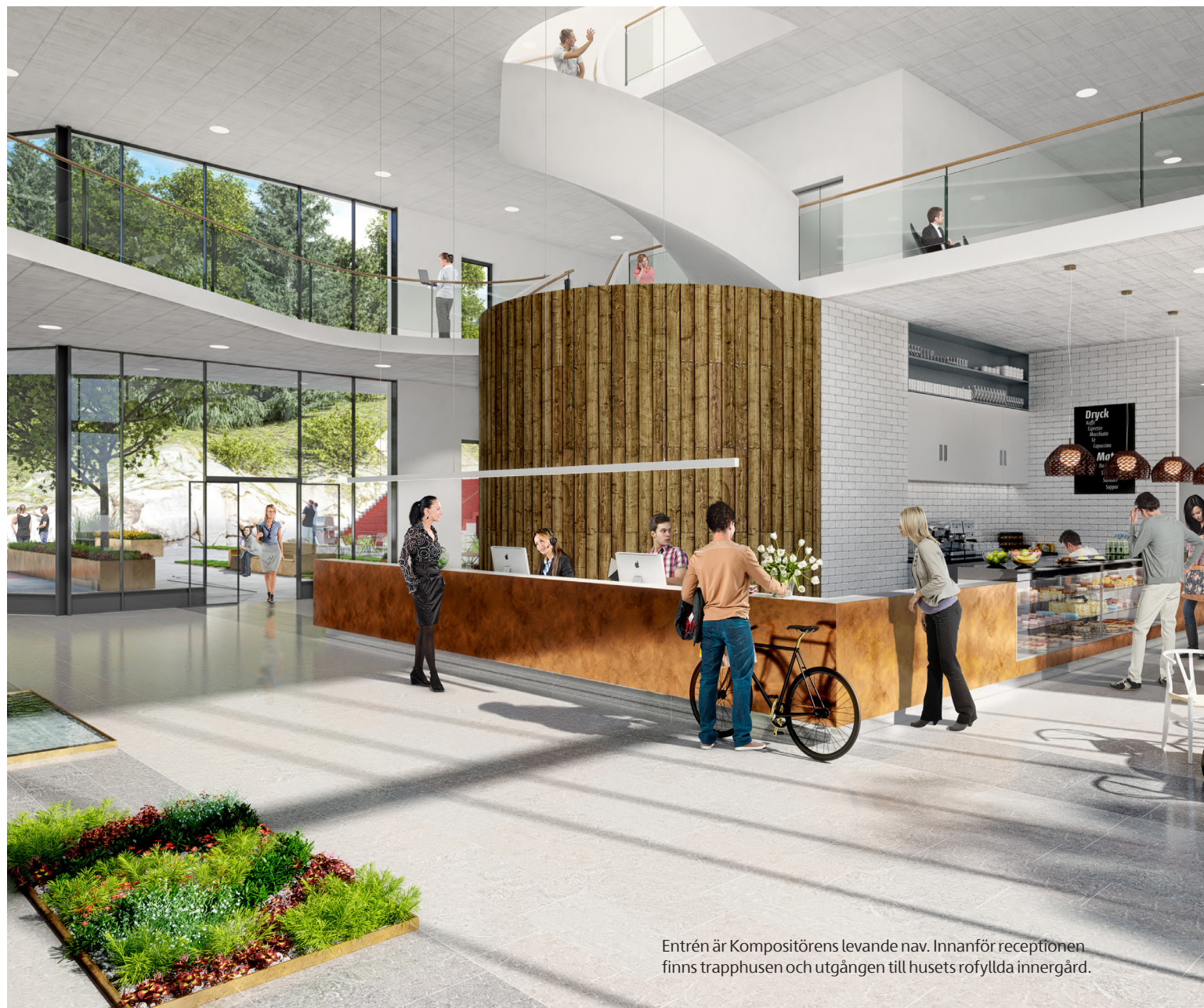
Entrén är Kompositörens levande nav. Innanför receptionen finns trapphusen och utgången till husets rofyllda innergård.

Även taket lockar med ytor för arbete, luncher och träning. Härifrån erbjuds en imponerande utsikt, norrut finns Solna och söderut innerstan där nya och gamla landmärken sträcker sig mot himlen, som Kungsholmsporten och Stadshuset.