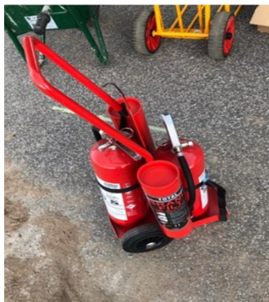
Vagn för släckutrustning underlättar arbetet.